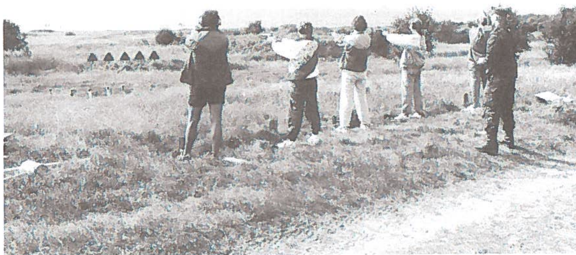
Fra skydekonkurrencen i feltsport 1995 - Jægerspris