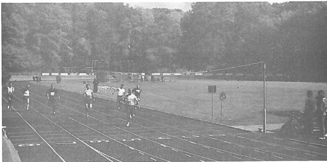
Finale 100 m Iøb (M). Vinder: SGE K. Andersen, SGI i tiden 10,8 sek