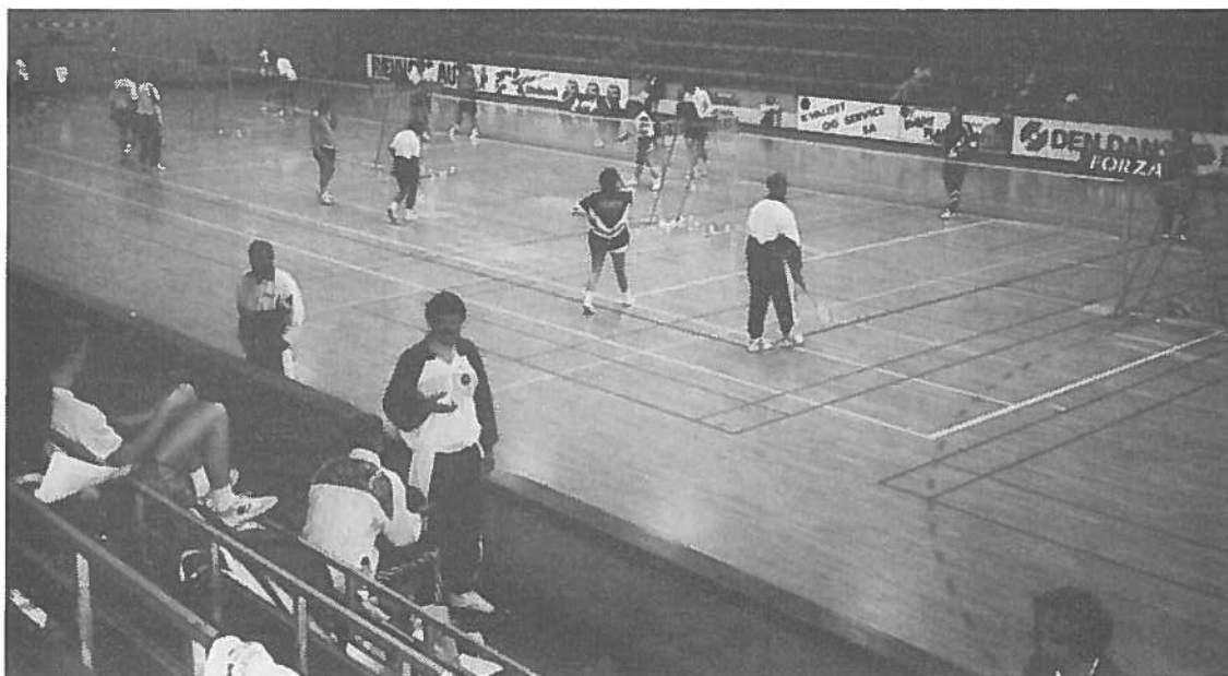
Badminton 1995 i Nørresundby Idrætscenter

Som følge af henvendelser om ændring af bl. a. deltagerantallet, fra de enkelte idrætsforeninger i rækker med lav deltagelse, samt aldersopdeling af damerækken, vil boldspiludvalget drøfte en mere gennemgribende ændring af hele turneringsformen.