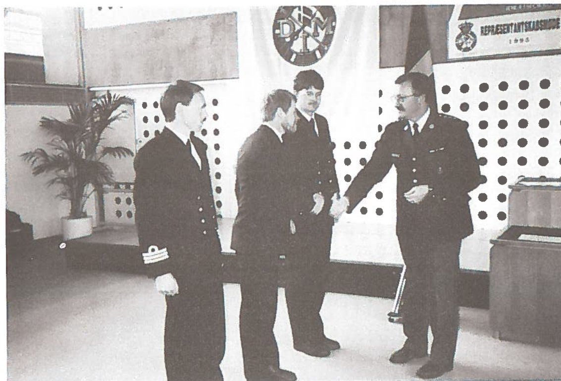
Verdensmestre i sejlads ved CISM 1994.