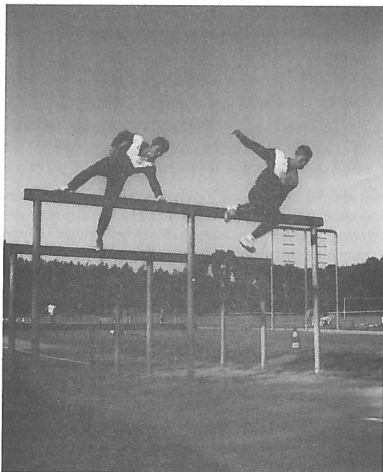
Militær femkamp 1995